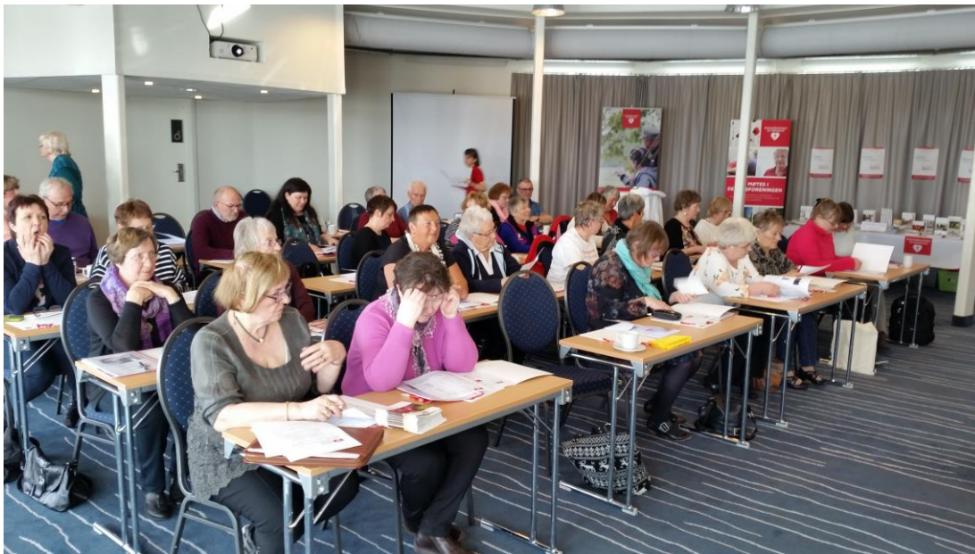
Årsmøtet i gang søndag morgen