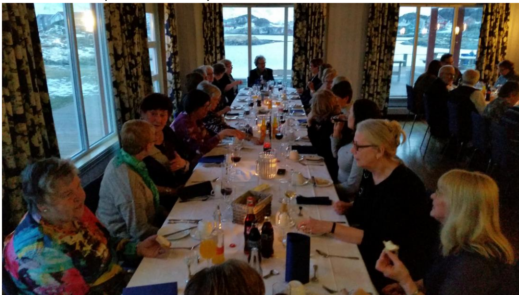
Lørdagens festmiddag i vakre omgivelser