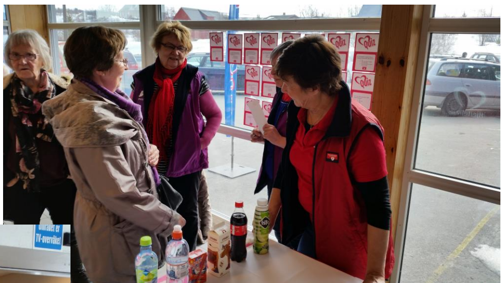
Minihelsetorget var godt besøkt