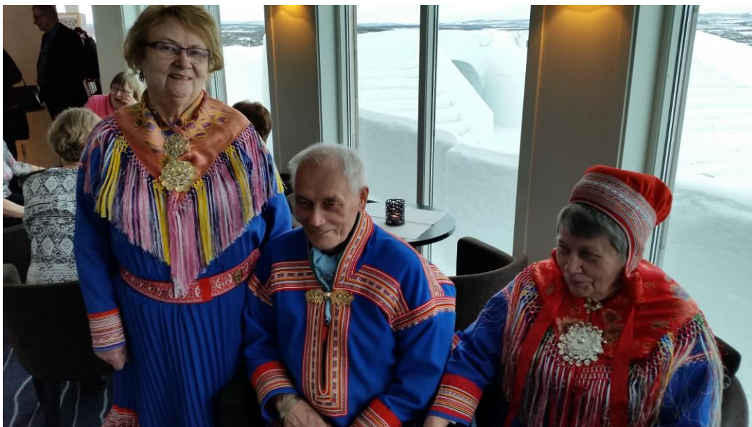
Festklede deltakere til årsmøtemiddag