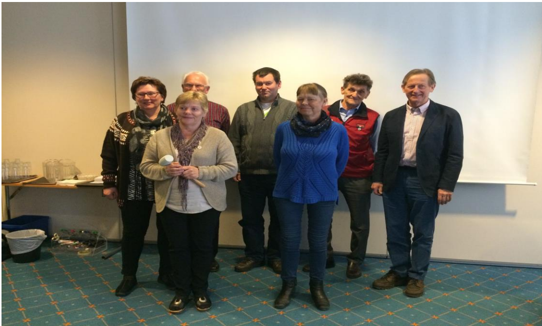
Det nye styret i Nordland fylkeslag