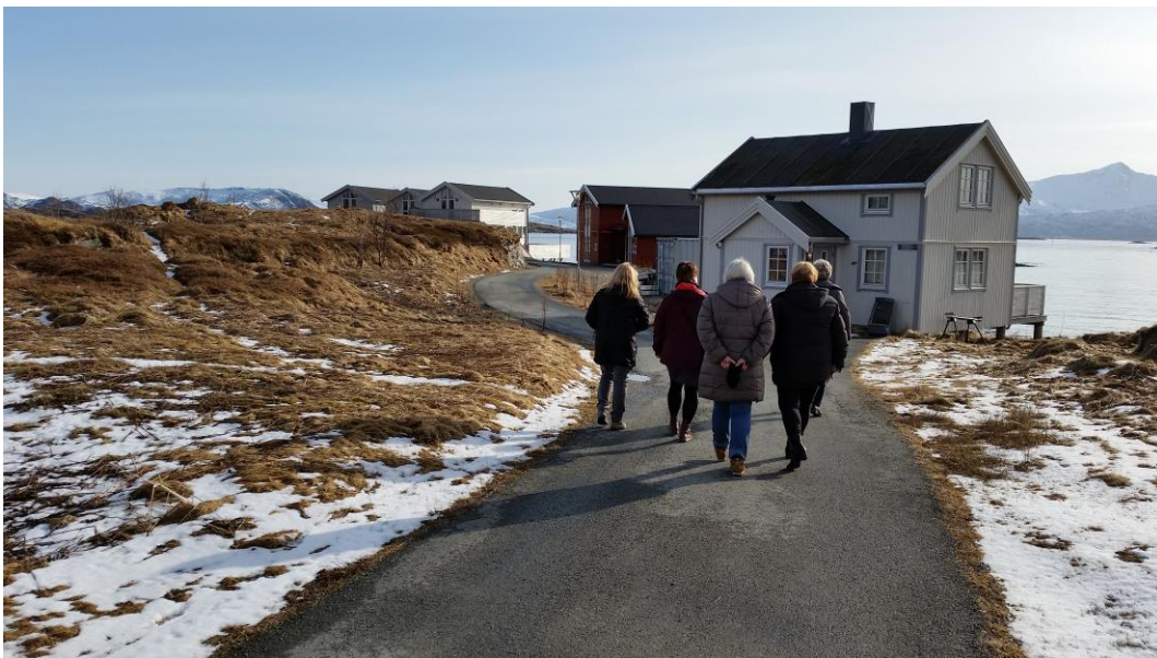
Flott natur på Sommarøy