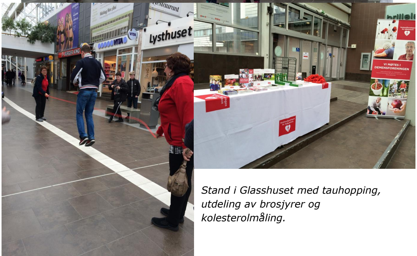
Stand i Glasshuset med tauhopping, utdeling av brosjyrer og kolesterolmåling.