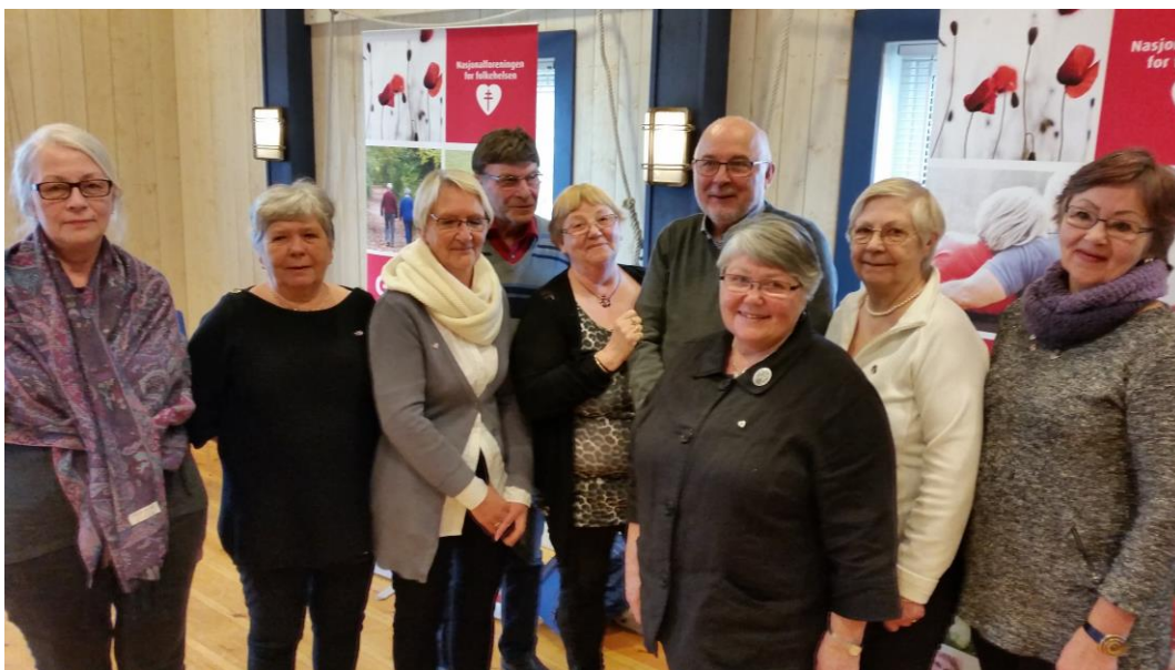
Det nye styret i Troms fylkeslag