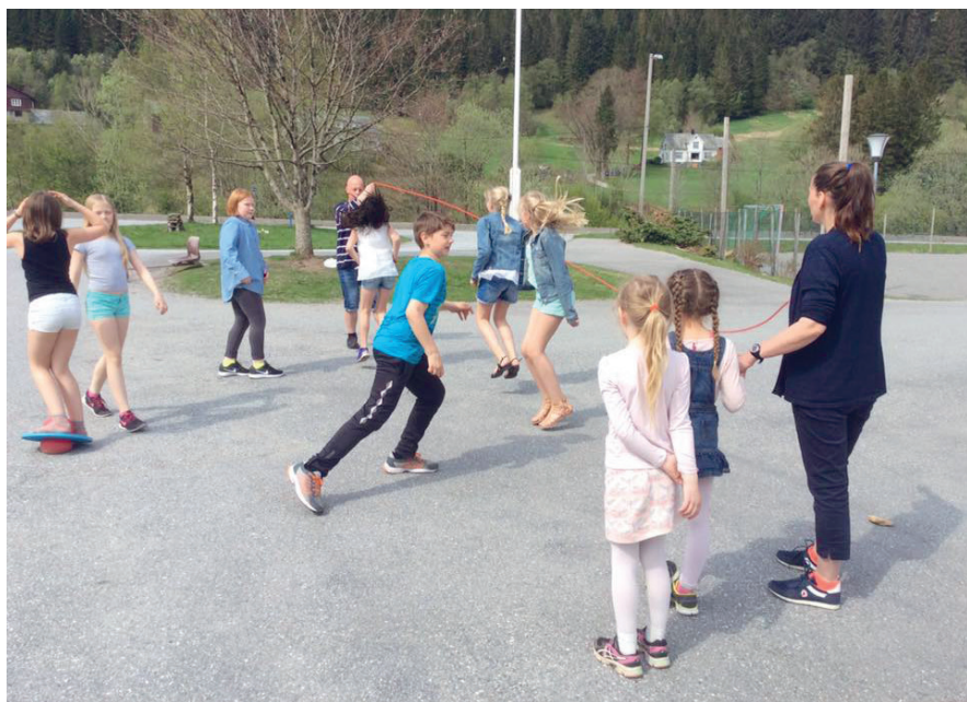
Mykje god hopping på skuleplassen på Brekke skule.