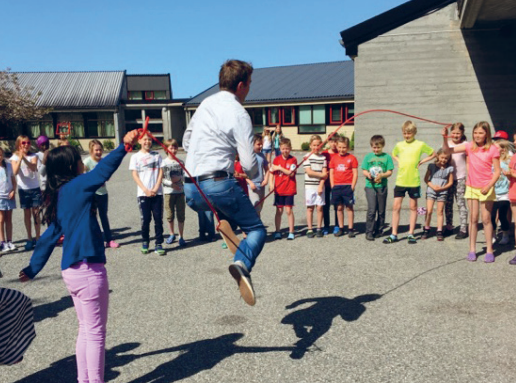
Hoppande glade elevar ved Olsvik skule blei fylkesvinnarar i Hordaland. Her er det rektor som viser sine kunstar under premieutdelinga.