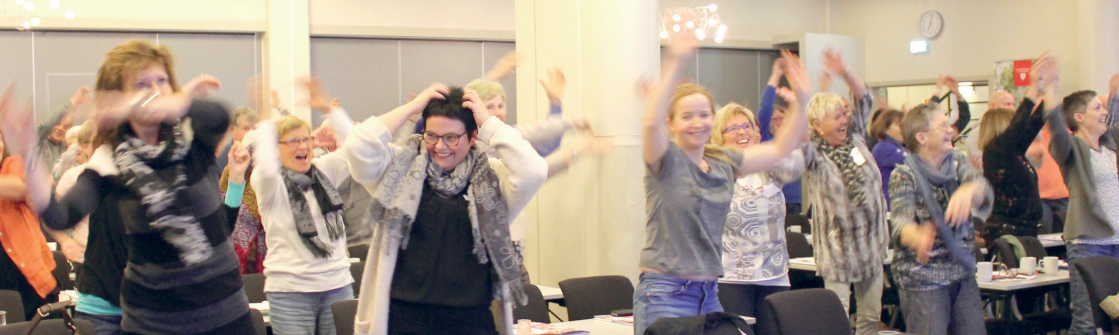
Pausedans i Bergen