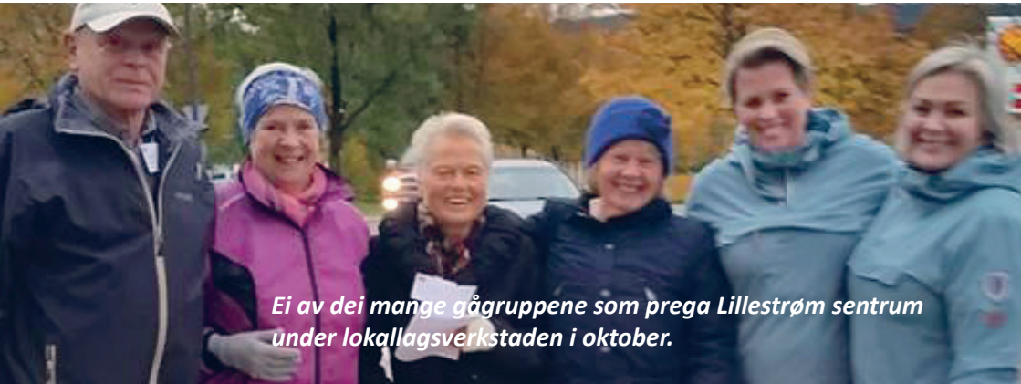
Ei av dei mange gågruppene som prega Lillestrøm sentrum under lokallagsverkstaden i oktober.