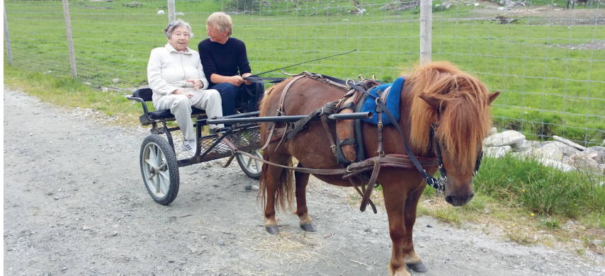
Frå Hornindal demensforening si utflukt til Nave hjortefarm.