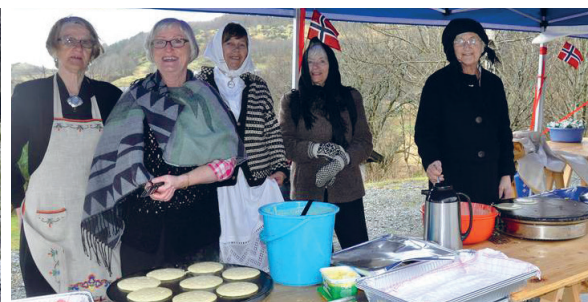
Friske og fine damer i Meland helselag: