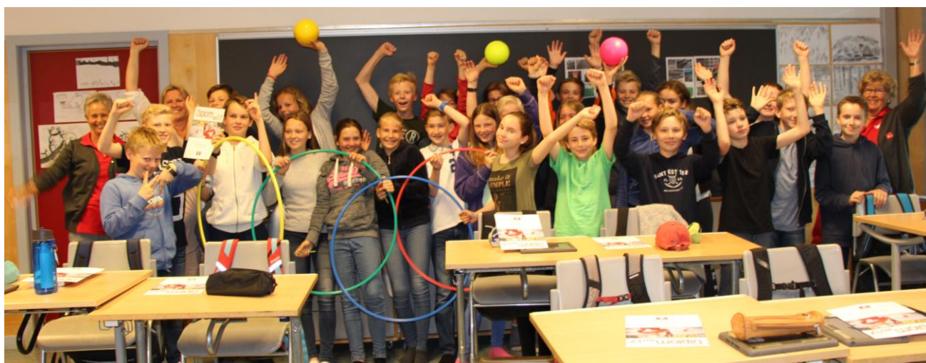
ble 7. trinn ved Eiksmarka skole i Bærum. På bildet over ser vi en hoppende glad vinnerklasse.