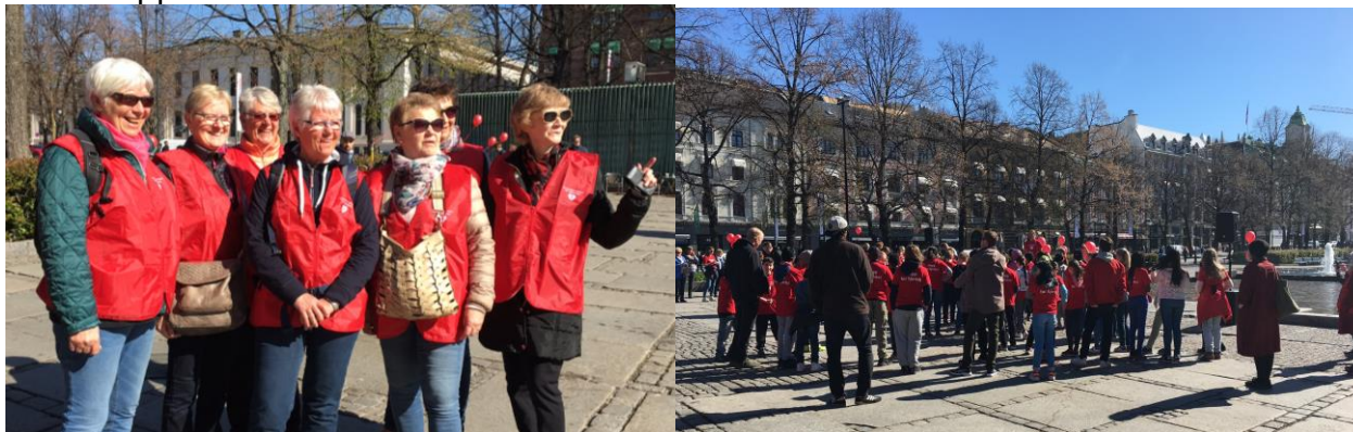
På bildet spreke damer fra Trøgstad Båstad helselag, Østfold.

Elever fra Lilleborg skole i Oslo var invitert til å hoppe den nye hoppetaudansen. Nytt av året var at tillitsvalgte fra Oslo og Østfold, representert ved Oslo fylkesstyre og Trøgstad Båstad helselag, bidro med å kutte opp og dele ut frukt til de hoppende barna.