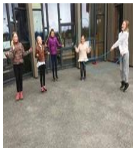
Fra Frei barneskole.

I Møre og Romsdal 2016 deltok totalt 103 skoler og 6330 elever. Dette skjedde i år: