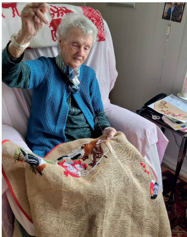
En sprek 100-åring i ferd med å sy årets julegave.