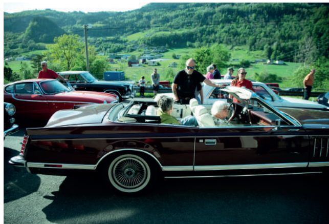
Blå himmel og sol som blinker i blanke biler - mange gode minner for flere av deltagerne.

De la aktiviteten på ettermiddagen, slik at pårørende kunne følge de og delta i arrangementet selv.