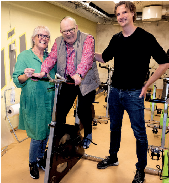
Studier viser at regelmessig trening er medisin for hjernen, og kan bedre sykdomstilstanden for personer med demens.

En studentoppgave ved idrettsvitenskapsstudiet ved Høgskolen i Lillehammer for ti år siden, har ført til et unikt treningsprosjekt for personer med demens og et godt samarbeid med Nasjonalforeningen Lillehammer demensforening.