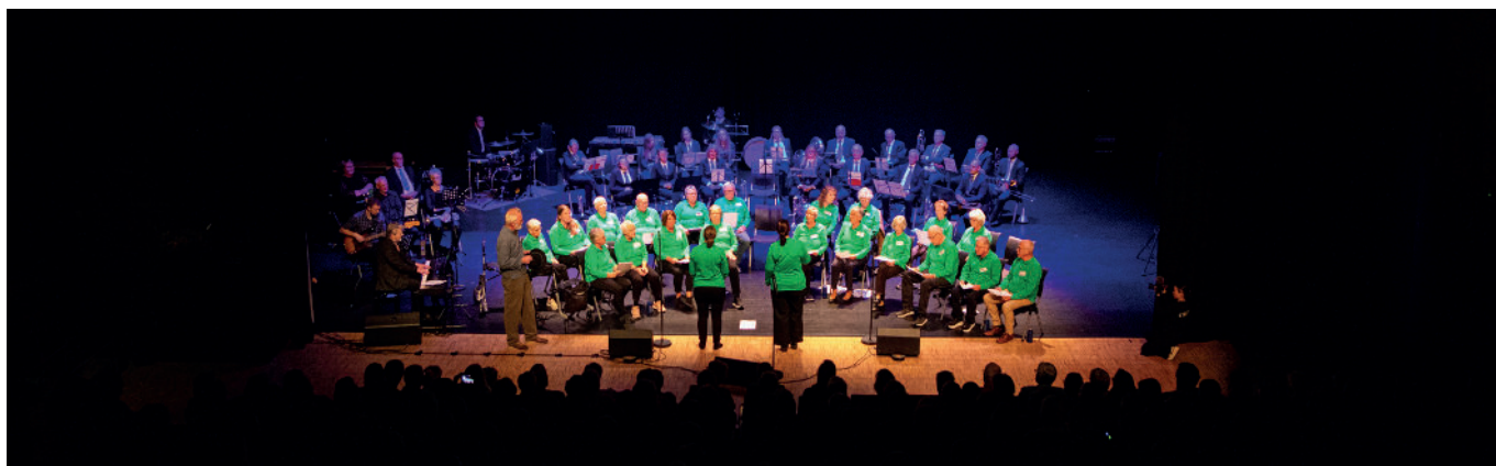
Gudbrandsdalen Demenskor har allerede rukket å ha to konserter siden april, den siste nå i forbindelse med Demensaksjonen.