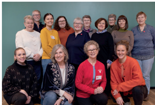
Kursdeltagere fra 2023.

Opplæringshelgen er gratis. Kontakt Demenslinjen på 23 12 00 40 eller send mail til: demenslinjen@nasjonalforeningen.no for mer informasjon, samtale og påmelding.