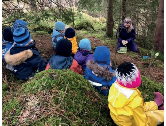
Denne gjengen er vant til både bratte bakker og regnvær!

Måltidet ble avsluttet med en kurv fylt med bananer og epler, samt en liten overraskelse - kanelnurrer!