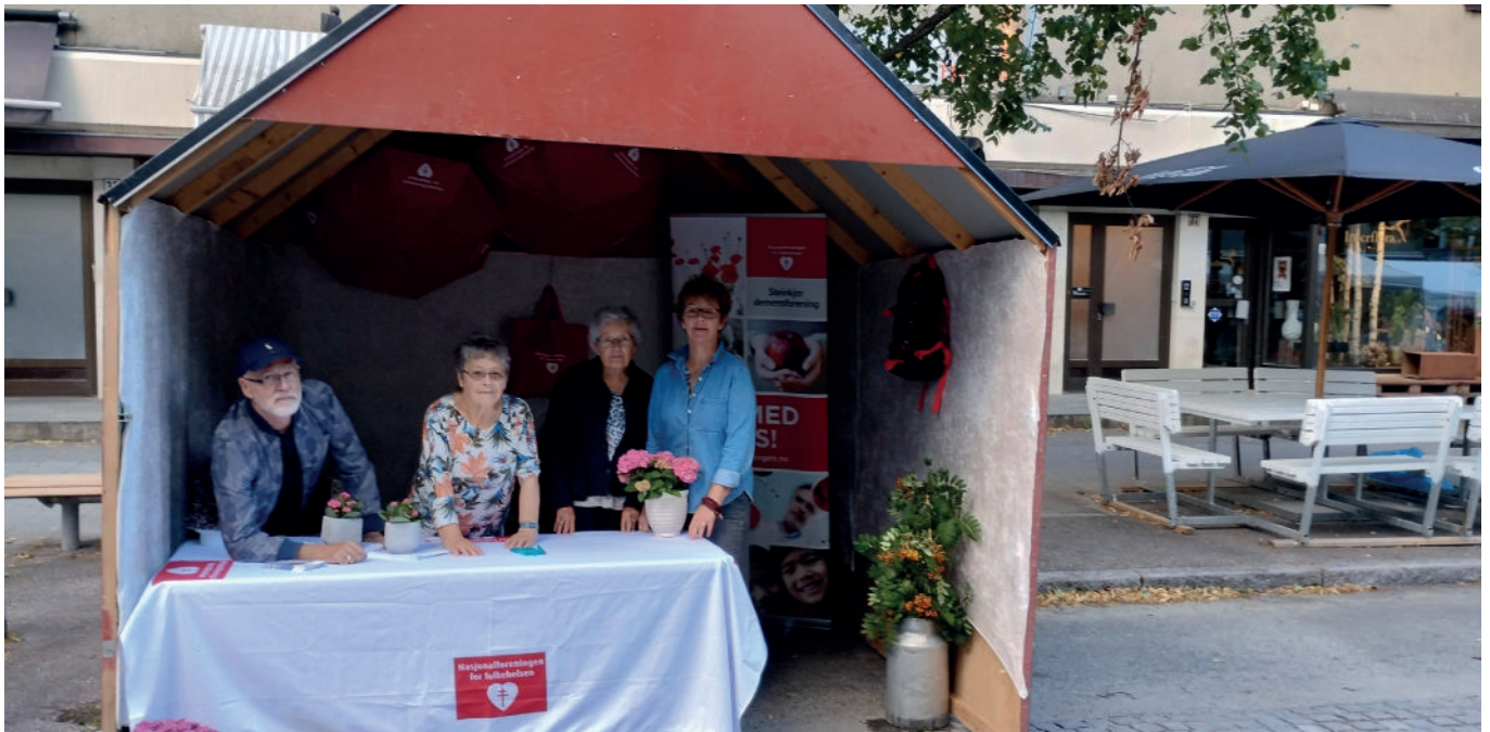
Flinke folk på stand under Steinkjer-martnan.

Nasjonalforeningen for folkehelsen er en medlemsorganisasjon, og hvert medlem bidrar til en sterkere stemme i arbeidet vårt.