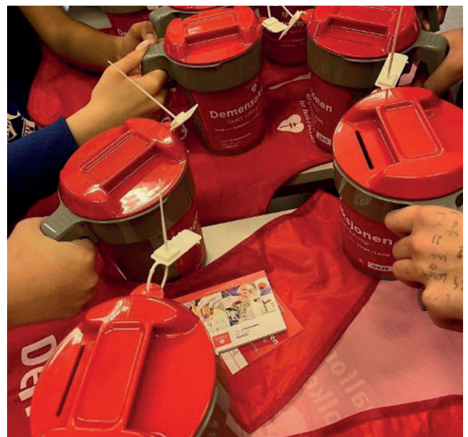
Bøsser og vester klar til henting på skolene i Hustadvika kommune.

– Og takk til alle som har støttet aksjonen og bidratt til forskning og lokalt demensarbeid. Bare forskning kan stoppe demens.