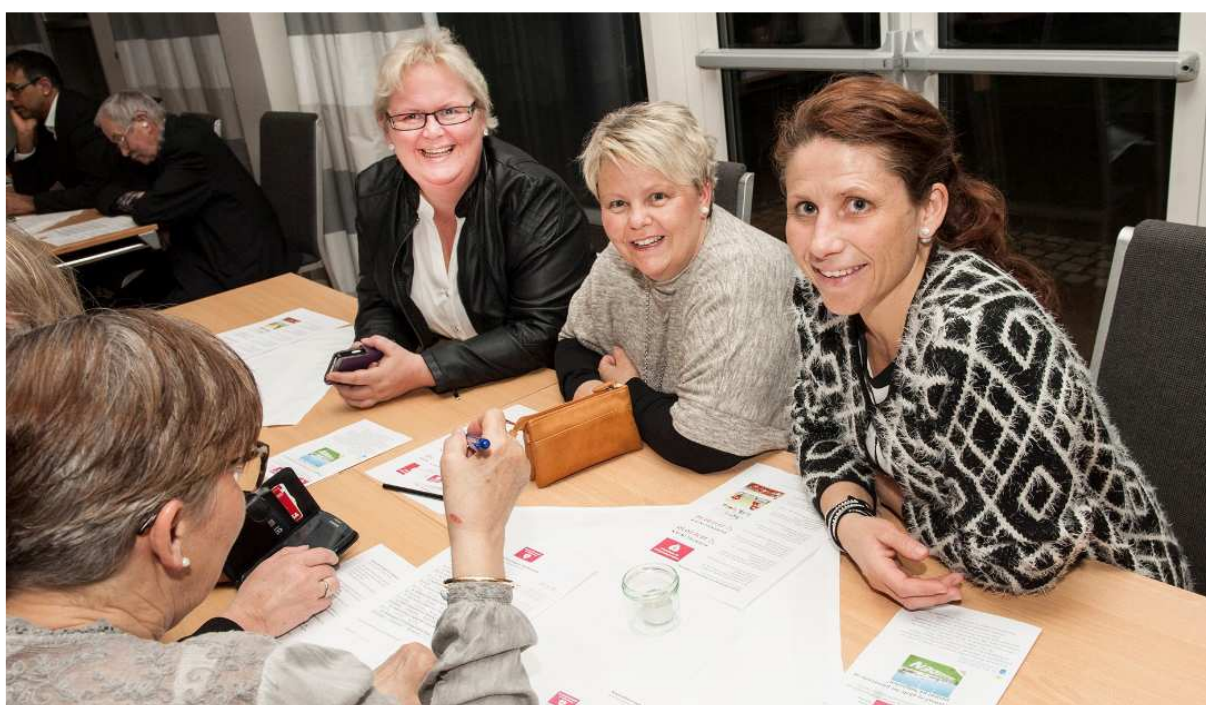
VANT: Laget «Youngones» gikk seirende ut av konkurransen.