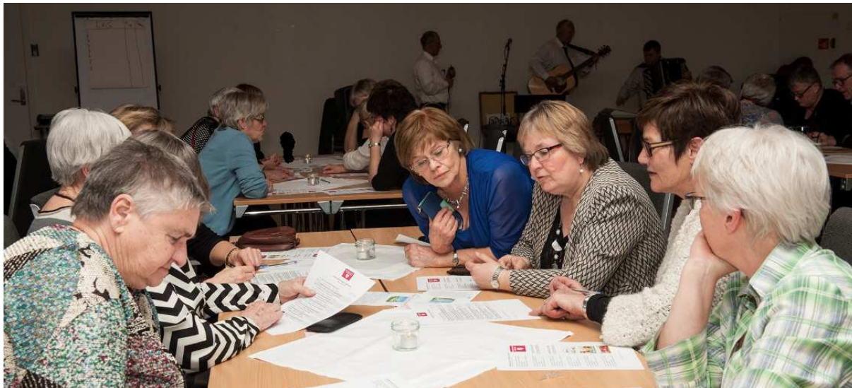
12-RETTE: Ivrige og konsentrerte deltakere under konkurransen.