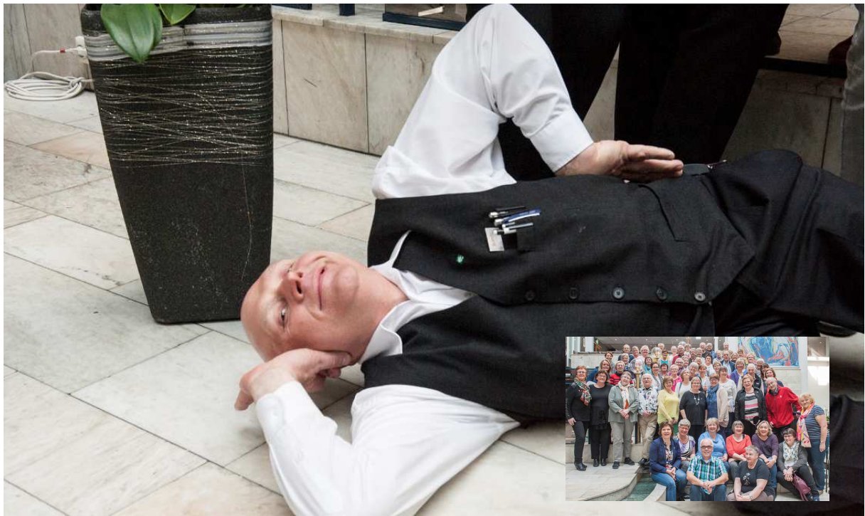
SPILLOPPMAKER: Den ansatte som gjøglet da vi tok fellesbildet 😊