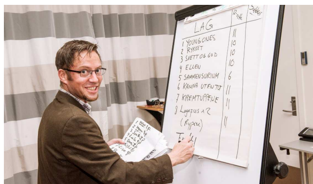
KONKURRANSE: 8 lag deltok på den todelte utfordringen «Nasjonalforeningens tippekupong» og «Tipp antall sukkerbiter i drikken»