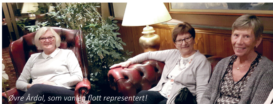
Øvre Årdal, som vanleg flott representert!

På samlingane hadde vi og erfaringsutveksling i mindre grupper om bl.a Aktivitetsvenn/«Musikk og trening»/Gode aktivitetar/Medlemspleie m.m. Fylkesstyret bad om tilbakemelding på om kva dei evt. kunne hjelpa lokallaga med. "Å få tak i nye medlemmer, som kanskje ønskjer å gå inn i eit styre", var eit av svara der.