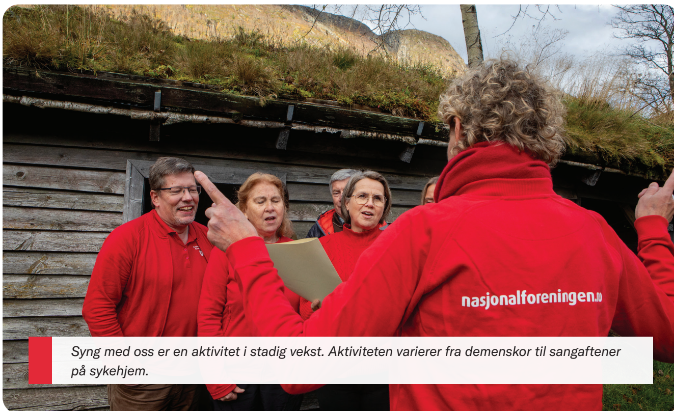
Syng med oss er en aktivitet i stadig vekst. Aktiviteten varierer fra demenskor til sangaftener på sykehjem.

Sentralstyret takker bidragsyterne for støtten som gjør vår innsats for folkehelsen mulig. Vi takker også rådsmedlemmer, øvrige tillitsvalgte og medlemmer for den frivillige innsatsen som gjøres lokalt. Alle som arbeider i Nasjonalforeningen for folkehelsen, takkes også for innsatsen.