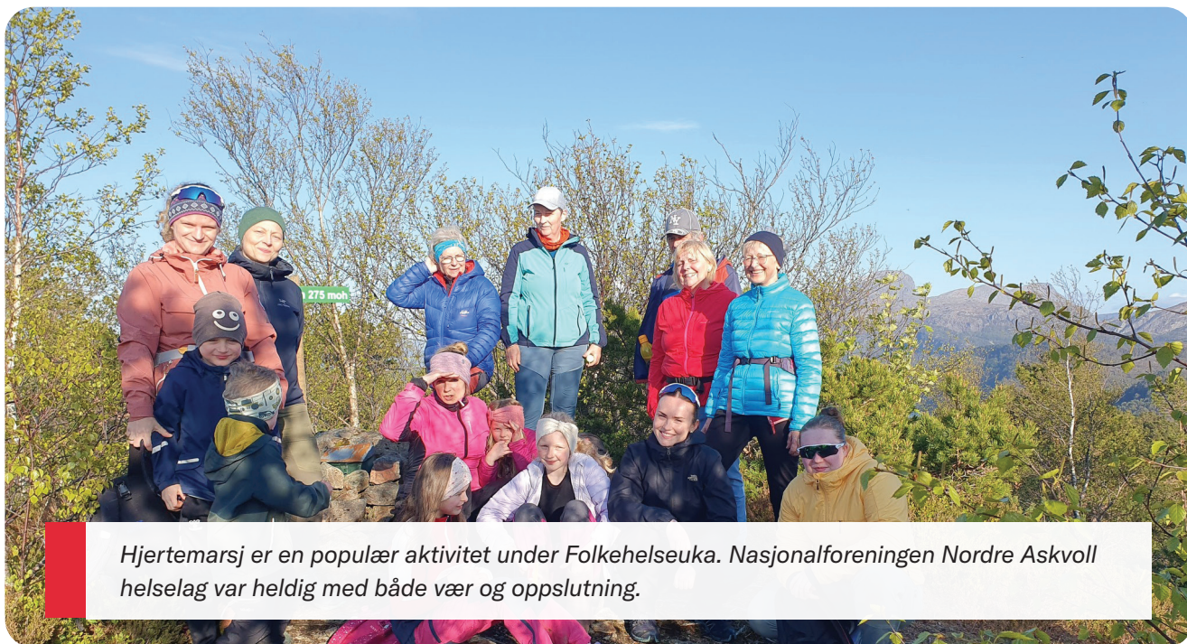
Hjertemarsj er en populær aktivitet under Folkehelseuka. Nasjonalforeningen Nordre Askvoll helselag var heldig med både vær og oppslutning.

Vi har jobbet gjennom flere år for begrensninger i markedsføring av usunn mat og drikke overfor barn. Da forskriften om å forby slik markedsføring trådte i kraft i fjor var dette en viktig seier.