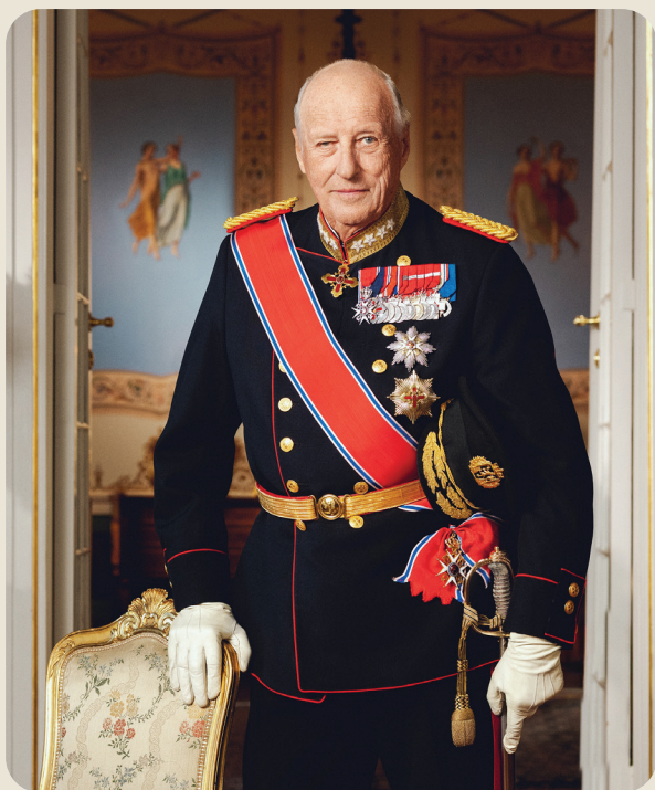
H. M. Kong Harald V Nasjonalforeningen for folkehelsens høye beskytter

Organisasjonen er partipolitisk uavhengig og livssynsåpen. Mangfold og inkludering er viktig i organisasjonens arbeid.