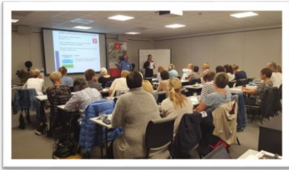
Aktivitetssvenn; første samling for arbeidsgrupper, med 17 kommuner

Valgfag Aktivitetssvenn; kurs nummer tre ved Sagavoll folkehøgskole. Engasjert ungdom, klar for innsats til personer med demens ved Furumoen omsorgssenter i Sauherad.