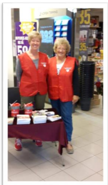
To flinke damer på stand