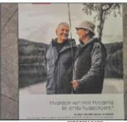
Tilbud til alle «Det er viktig å få fram at tilbudet er for alle»

Kurs i høst «Her kommer dere de nødvendige pengene til å sette i gang alle prosjekter»