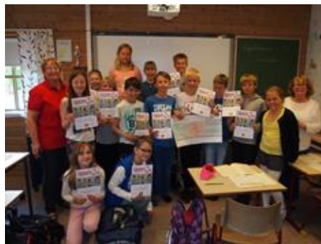
Fiane skole 6.klasse fikk en flott 2. plass i konkurransen.