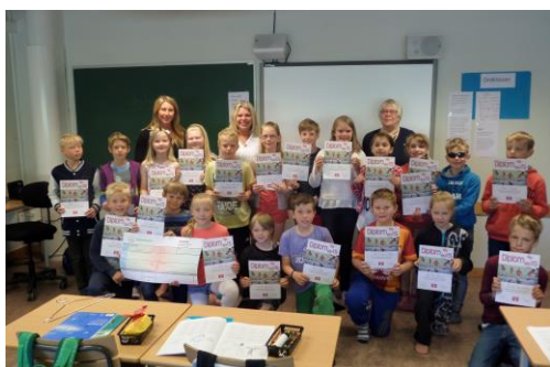
Vinnere fra 4.klasse Eide skole i Grimstad/Homborsund

Hopp for hjertet motiverte 2 082 elever ved 30 skoler i Aust-Agder til en aktiv skolehverdag.