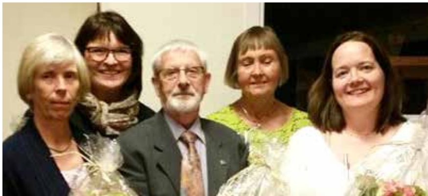
Styret i Kvinnherad demensforening