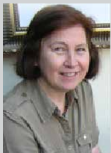
Helsing frå Asborg Leirdal Kjærvik – fylkesleiar Sogn og Fjordane

Eg vil ynskja dykk alle ein aktiv sommar!