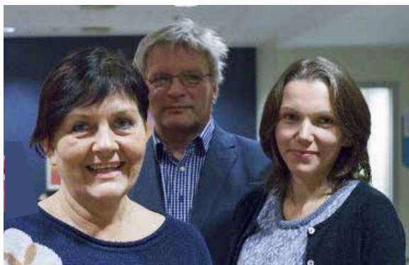
Tre i styret i Sunnfjord demensforening