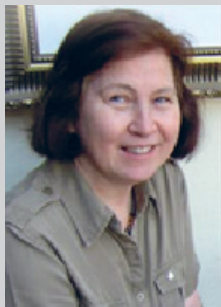
Helsing frå Asborg Leirdal Kjærvik – fylkesleiar Sogn og Fjordane