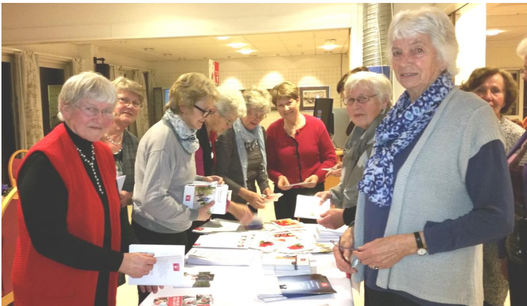
Regionmøtet i Vestfold ble arrangert på Tjølling sykehjem. Her er noen møtedeltagerne i ferd med å sikre seg noen «go'biter» fra Nasjonalforeningens rikholdige brosjyremateriell.

I Buskerud ble det også arrangert et regionmøte på Veggli. Der var det Rollag og Veggli helselag som sto som vertskap. På alle regionmøtene var det god stemning og inspirerende møtedeltagere, noe som bidro til gode diskusjoner, som igjen kan føre til at Nasjonalforeningen vil stå ennå sterkere i fremtiden.